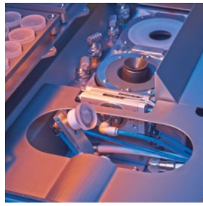
Optionale Wasch- und Drehstationen