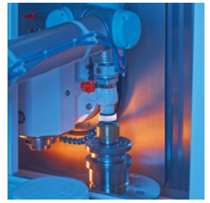
全自动的装卸系统