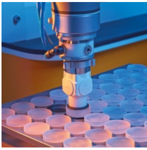
超灵敏的镜片装卸系统