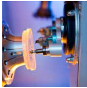
Auto-calibración de herramientas.