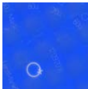
Variations de l'intensité de la gravure.