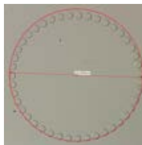
Cercle de 1,6 mm formé par des points de 60 μm.