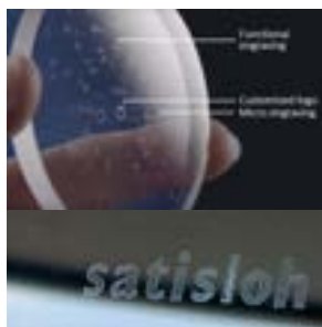
Gravure de logos et marquages fonctionnels.