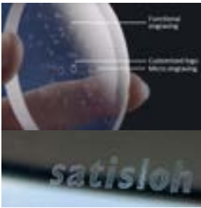
Funktionsgravuren und Branding.