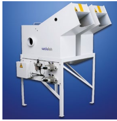
Separadora de resíduos