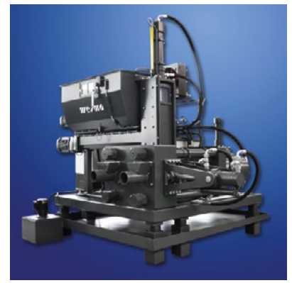
Prensa briquetadeira WEIMA para gestão de resíduos