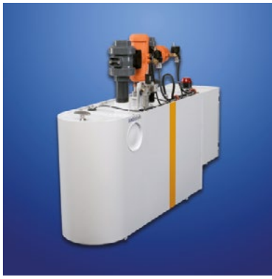
Estação de bombeamento integrada e Estação de bombeamento separadora de resíduos de perfil reduzido