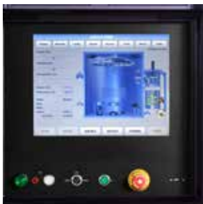
Software HMI de fácil utilização