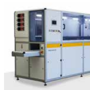
Sistema de limpeza ultrassônico totalmente automatizado Hydra-sonic-40