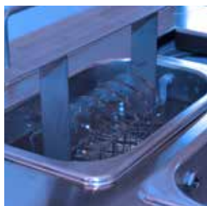
Processo semi-automatizado de limpeza e secagem Hydra-sonic-5