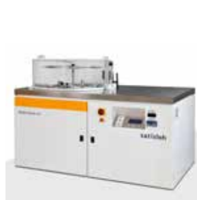
Sistema compacto "conecte e lave" Hydra-sonic-10